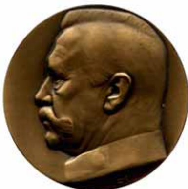
7349 Große Bronzemedaille. K. GOETZ (Karl Goetz). Kopf rechts mit Kragen. / Schrift in zehn Zeilen im Lorbeerkranz. 83 mm. 200 g. Kienast 385. .... Vorzüglich 100,-