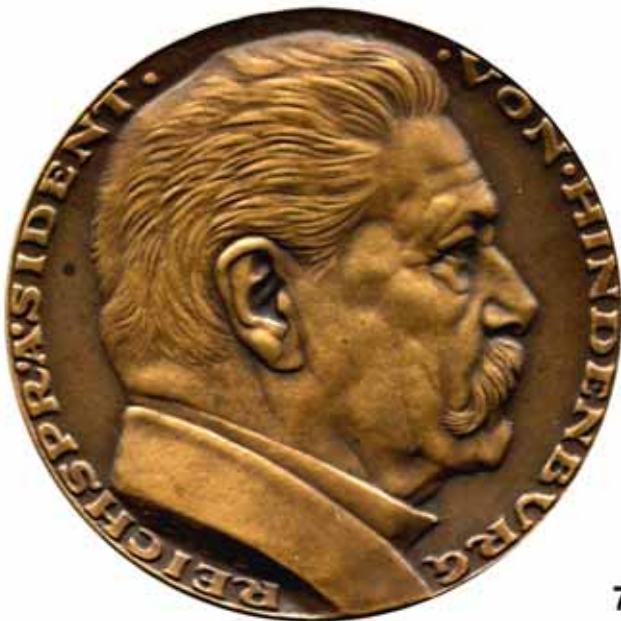
7348 Große Silbermedaille. K. GOETZ (Karl Goetz). Kopf rechts mit Kragen. / Schrift in zehn Zeilen im Lorbeerkranz. Rand: SILBER. 83 mm. 177,7 g. Kienast 385. .... Vorzüglich 150,-