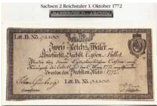
Erstes sächsisches Papiergeld und zugleich erstes deutsches Papiergeld, das wirklich als Zahlungsmittel zirkulierte