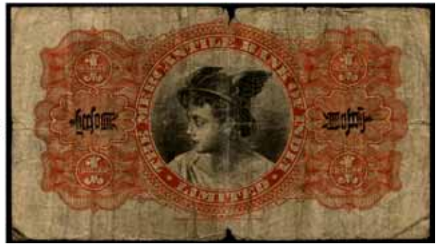
3129 China, Mercantile Bank of India, 1 Dollar 1.7.1924. Pick S 446.....Einriße, sehr stark gebraucht 120,-