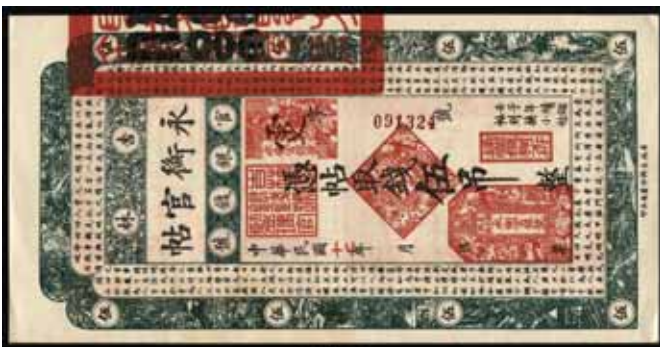
3132 - Charhar Commercial Bank, 5 Yuan 1.12.1933. Pick S 856 C.....Kl. Loch, kaum gebraucht 20,-